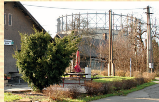
Johanova buda, vzadu plynojem Třineckých železáren