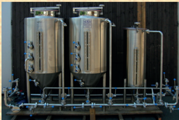
Kvasničárna "Koníček" před expedicí z Blučiny